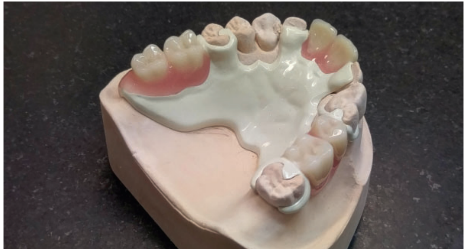
Fertige Teilprothese aus Ultaire AKP am Modell

Doch jetzt kommt allmählich das Aus für Metall – die Alternative ist ein neuer Kunststoff, ein sogenannter Hochleistungspolymer Ultaire AKP. Teilprothesen aus Ultaire AKP sind metallfrei, bioverträglich und sind von enormer Stabilität. Ein weiterer Vorteil des neuen Kunststoffes ist seine Geschmacksneutralität im Mund des Patienten