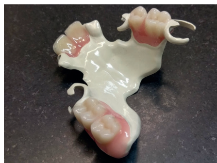
Fertige Teilprothese ohne Modell